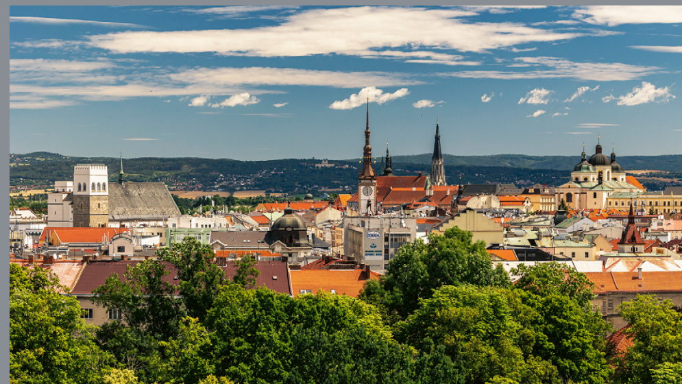
Panorama historycznego centrum Ołomuńca