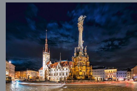
Rynek Górny w Ołomuńcu, ratusz i Kolumna Świętej Trójcy