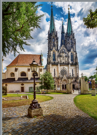
Katedra św. Wacława