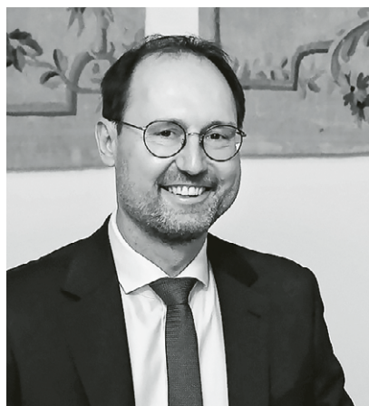
Břetislav Dančák Ambasador Republiki Czeskiej w Polsce

Wierzę, że wysłuchanie klasycznych dzieł w wykonaniu Orkiestry Symfonicznej Morawskiej Filharmonii Ołomuniec będzie dla Państwa niezapomnianym, napelniającym najlepszymi emocjami przeżyciem.